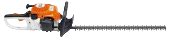
BENZIN-HECKENSCHERE HS 45

Ob Motorsense, Heckenschere oder Motorsäge mit unseren leistungsstarken Benzin-Geräten sind Sie für jede Aufgabe gerüstet. Wir bieten Ihnen eine große Auswahl an STIHL Geräten. Kommen Sie vorbei, wir beraten Sie gerne.