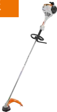
BENZIN-MOTORSENSE FS 55 R