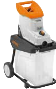
GHE 140 L