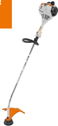
BENZIN-MOTORSENSE FS 38