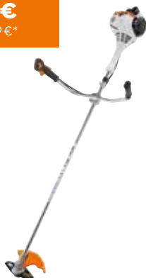
BENZIN-MOTORSENSE FS 55